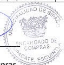
Elder Pineda Encargado de Compras