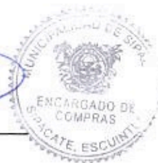
Elder Pineda Encargado de Compras